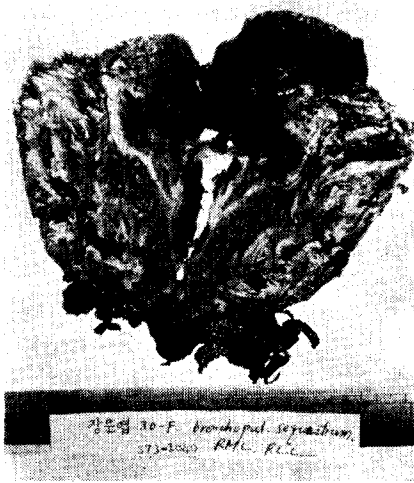
Fig. 3. Cut surface of specimen shows marked ectatic bronchi and large sequestrated cysts communication with bronchus.

육안적으로 하엽내에는 확장된 기관지를 볼 수 있었고 이것이 sequestrated lobe안에 있는 직경 약 5cm되는 3, 4개의 커다란 낭포와 교통되고 있었으며 그 안에는 농성 점액물질 및 괴사된 조직편을 함유하고 있었다. (Fig. 3) 현미경적으로 낭포벽은 columnar epithelium으로 이루어져 있었고 낭포주위는 임파구와 polymorphonuclear cell이 응집되어 있는 섬유성 결체조직으로 되어 있었다. 그리고 이 주위의 폐포는 압축되어 있었다.