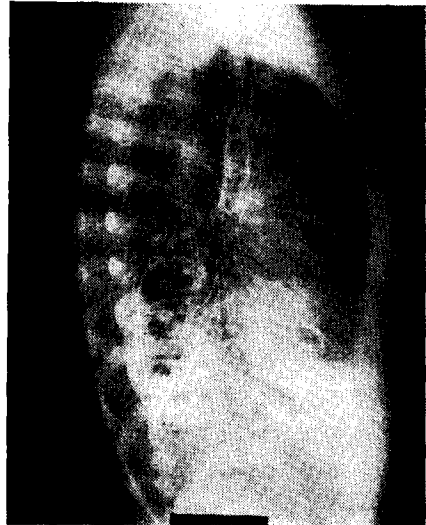
Fig. 2A and 2B. Right bronchogram shows ectatic bronchi of lower lobe and cystic sequestration filled with dye.