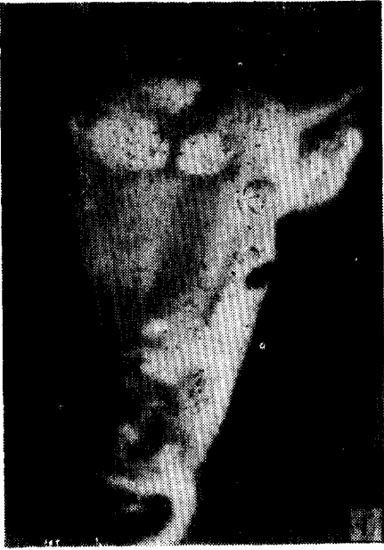
Fig. 5. Ringworm lesion of guinea pig inoculated with isolates for pathogenicity test.

Fig. 4. Chain arrangement of arthrospores ( 1.5\sim 2\mu\text{m} ), chlamydospores ( 5\mu\text{m} ) and chandelier are seen in slide culture. \times 680 .