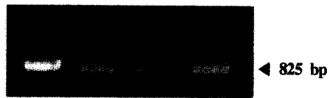
Fig. 2. Allele-specific PCR patterns before treatment with berenil in natural infected korean calves(50% parasitemia with T. sergenti ). PCR products were electrophoresed on 0.8% agarose gel in the presence of ethidium bromide. (lane U; Universal primer, lane I; Iketa type, lane C; Chitose type and lane B: Buffeli type)

였다. 그 동안 T. sergenti 감염조사 목적으로 사용되어 온 Universal type의 primer에서는 치료한 후 1개월 후인 7월을 제외한 모든 기간에서 모두 관찰하였으며, Universal type primer는 Ikeda type primer와 비교하여 적혈구내 T. sergenti 의 DNA 검출율이 낮았다.