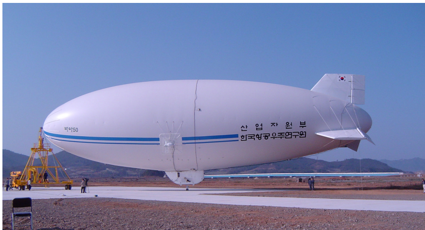
<그림 2> Mooring 장치에 매달린 50m급 무인비행선