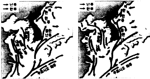
<그림 2> 겨울철과 여름철의 우리나라 주변해역의 해류 분포

우리나라 동해안의 해류의 분포는 <그림 2>에 나타난 바와 같이 북쪽에서 남하하는 북한한류와 남쪽에서 북상하는 쿠로시오 해류의 지류인 대마난류가 교차함에 따라 난수성 어종인 오징어와 한류성 어종인 명태와 청어 등이 해류의 분포에 따라 어장을 형성한다(<그림 3>). 최근에는 지구온난화에 따른 해수의 수온 상승으로 인해 난수성 어