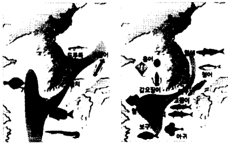
<그림 3> 우리나라 근해의 계절별 어종분포

종의 어획량이 증가하고 있기는 하지만 독도해역의 어장에서 잡히는 어종 중에서 특히 오징어는 국내 전체 어획량의 60% 이상을 차지하고 있다. 유자망(drift net) 어업으로 잡는 가오리와 열어 등과 통발어선으로 잡는 홍게와 새우