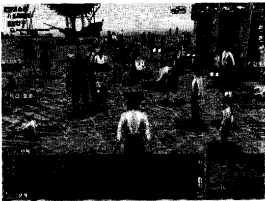
그림 1. 대항해시대 리스본의 항구 앞

현물거래의 폐해에도 불구하고 아이템의 희소성과 획득의 어려움 때문에 어느 온라인 게임에서나 아이템의 거래행위는 활성화 되고 있고, MMORPG의 흥미로운 시스템의 하나로 자리 잡고 있다[20].