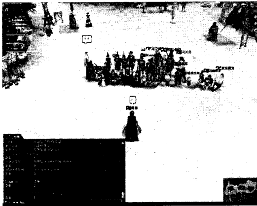
그림 2. 대전 모의 장면

유저들은 전투를 성공적으로 이끌기 위해 자신의 위치를 정한다. 분야별로 높은 기술치를 지니고 있는 유저들끼리 팀을 이루고 자신의 장기를 효과적으로 발휘할 수 있는 역할을 정한다. 「대항해시대」의 '대 해전' 시스템은 유저간의 팀웍이 발휘 될 수 있는 전투 시스템이다. 유저들은 두 패로 나뉘어 공격 팀과 방어 팀, 조달 팀을 구성한다. 조달 팀은 대 해전 장소 인근 해안에 모여 배를 무장시킬 장비들과 캐릭터를 강화시킬 무기들을 만들어낸다. 고도의 숙련 기술을 가진 여러 종류의 상인들이 모여 각종 장비들을 만드는 모습 또한 전투 씬 못지않은 장관을 연출한다[20].