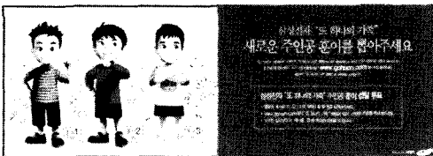
그림 1. 삼성전자 "또 하나의 가족"

광고 캠페인의 제작 과정을 살펴보더라도, '훈이네 가족 이야기' 캠페인의 특징을 알 수 있다. '훈이' 캐릭터의 경우 2만여 명의 고객 투표를 거쳐 3개의 캐릭터 후보작 중에서 70% 이상의 득표로 결정하였다(그림 1). '훈이'는 97년 4월생(또 하나의 가족 캠페인 시작시기)으로 초등학교 4학년에 재학 중인 밝고 명랑하며 호감 가는 어린이 상으로 설정하였다. 그리고 '훈이'라는 이름은 지난 10년간 또 하나의 가족이 전한 '훈훈한 감동' 또는 '훈남'이라는 뜻을 담고 있다[7].