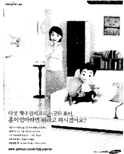
그림 2. 또 하나의 가족 "훈이네 가족이야기"