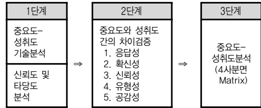
그림 2. 연구절차

또한 26개의 설문항목을 크게 응답성, 확산성, 신뢰성, 유형성, 공감성으로 5가지로 분류하고, 각 설문항목의 응답척도는 5점척도를 하였다. 이용 전 중요도 문항에서는 1점 '전혀 중요하지 않다' 에서 5점 '매우 중요하다'로 측정하였으며, 이용 후 성취도 문항에서는 1점 '매우불만족' 5점 '매우만족'으로 측정하였다. 이러한 과정을 통해 연구절차와 변수의 조작적 정의를 요약하면 다음과 같다.