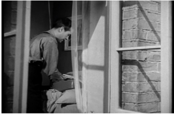
그림 7. 전환 테마 장면 중