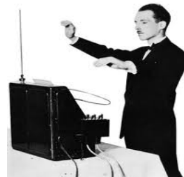
그림 2. 테레민을 연주하는 레온 테레민