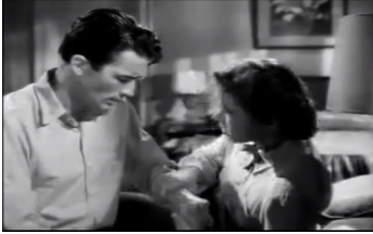
그림 4. 남자의 기억 테마 장면 중