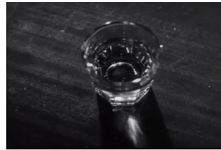
그림 6. 남자의 술 테마 장면 중

술 테마는 주인공 돈의 알코올 중독을 보여주는 사물 테마로써 술이 화면에 등장하거나 돈이 심적으로 술을 생각할 때 항상 등장한다. 술 테마는 항상 테레민이 함께 연주되는데, 이것은 주인공이 알코올 중독자라는 것을 대변해주는 악기이기도 하다. 불안하며 초조해지는 알코올중독자의 증상과 심리를 잘 표현해주고 있다.