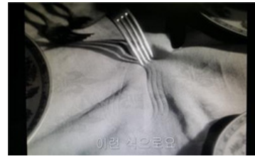
그림 3. 남자의 정신착란 테마 장면 중

메인 테마에도 등장하는 남자의 정신착란 테마는 남자 주인공의 정체성 혼란으로 인한 불안감을 나타냈을 때와 [그림 3]과 같이 흰 선에 대한 발작 증상을 보여주는 장면에서 등장한다. 이 때 사용된 주요 악기는 테레민이며, 남자의 관점으로 남자의 불안한 감정 상태와 정신착란 증상을 보여주는 역할로써 사용된다.