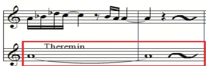
악보 3. 남자의 꿈 테마

위의 악보에서 상성부의 멜로디를 플루티 빠르게 연주될 때, 하성부의 지속음을 테레민이 동시에 연주한다. 이것은 남자주인공의 불안한 내면을 나타내준 것이다.