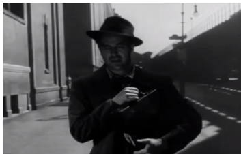
그림 8. 남자의 중독 테마 장면 중