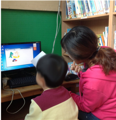
그림 2. 파일럿 테스트를 위한 수업 장면

수업이 진행되는 동안 아이가 멀티미디어 그림책에는 집중을 하였지만 교사와의 소통이 원만한 편은 아니었다. 교사의 진술에 따르면, 평소 수업에 비해 아이가 매우 집중하고 있는 것이라고 하였다. 하지만 연구자가 보았을 때, 아이는 교사의 질문에 짧게 대답하거나 질문의 내용과 관련 없는 말을 했다. 또한, 이야기 내에서의 각 상황에 따른 인물의 감정을 묻는 질문에 아이는 대답을 제대로 하지 못했다. 아이는 인물의 감정을 말로 표현하기 힘들어했다. 반면에, 아이는 멀티미디어 그림책의 각 상황에 따른 행동선택에서는 모두 상황에 적절한 선택을 하였다. 비록 아이가 상황에 대한 표현이나 선생님과의 대화에는 미숙한 점을 보였지만, 아이는 이야기의 흐름을 따라가면서 적절한 행동을 선택하였음을 알 수 있다. 일회성의 파일럿 테스트이지만, 개발된 콘텐츠는 아이들에게 흥미를 유발시키고 있고 이런 흥미를 통한 교육의 집중도를 향상 시켜서 아이들의 행동을 교정할 수 있는 잠재력을 가지고 있다고 추정할 수 있다.