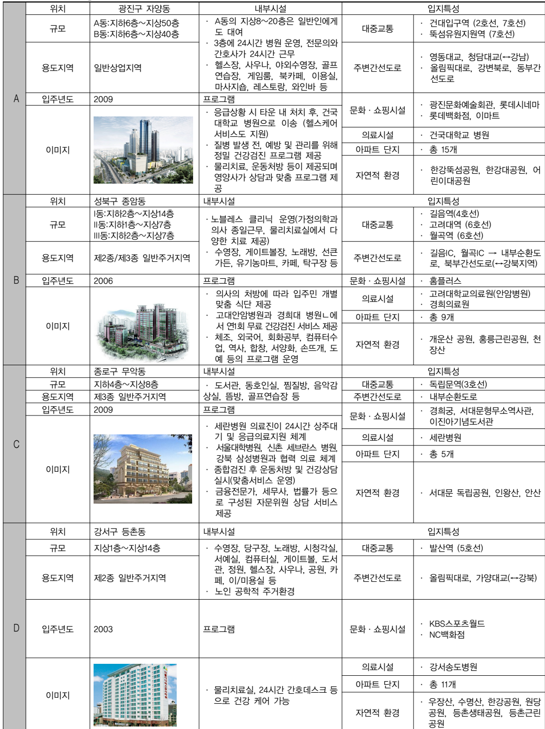
표 5. 서울시 도시형 실버타운 사례 분석