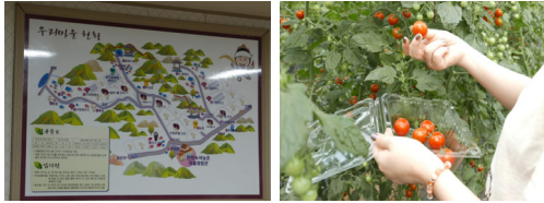
그림 2. A 농촌관광지

또한 A농촌관광지는 농촌체험관을 중심으로 각종 운영 및 홍보를 진행하고 있지만, 홈페이지 등은 운영되고 있지 않고 있다. 이에 반해 B농촌관광지의 경우 관광협의체를 중심으로 한 운영 및 홍보를 하고 있으며, 홈페이지를 통해 각종회원모집, 프로그램 예약, 특산물 홍보 및 구매 등의 편의를 제공하고 있다.