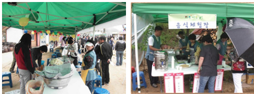
그림 3. B 농촌관광지

또한 A농촌관광지는 농촌체험관을 중심으로 각종 운영 및 홍보를 진행하고 있지만, 홈페이지 등은 운영되고 있지 않고 있다. 이에 반해 B농촌관광지의 경우 관광협의체를 중심으로 한 운영 및 홍보를 하고 있으며, 홈페이지를 통해 각종회원모집, 프로그램 예약, 특산물 홍보 및 구매 등의 편의를 제공하고 있다.