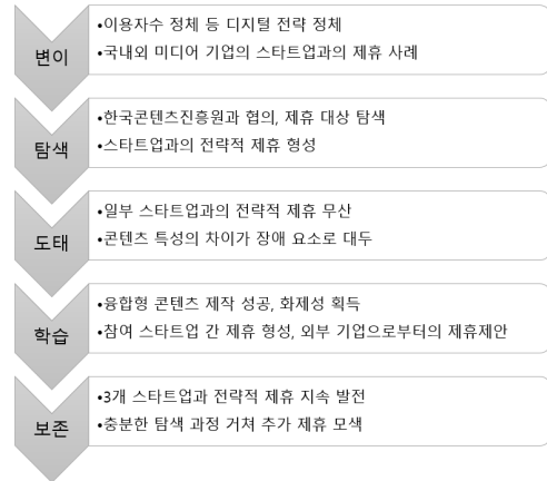
그림 2. KBS-스타트업 제휴의 단계별 진화 양태 정리

KBS와 콘텐츠 스타트업의 전략적 제휴 경험은 전략적 제휴의 관계 내부와 외부에서 긍정적 영향을 미쳤다. KBS는 시범사업의 경험을 바탕으로 본 사업에 참여하는 3개 콘텐츠 스타트업 이외에도 참여 업체를 더 모집해 스타트업과의 제휴관계를 확대해갈 계획을 갖고 있었다. 특히, 한국콘텐츠진흥원의 스타트업 육성 프로그램에 참여한 스타트업을 추천받는 형식으로 제휴했던 시범사업의 방식을 개선해 본 사업에서는 충분한 탐색 시간을 갖고 전략적 제휴에 적합한 스타트업을 선정할 계획이다.