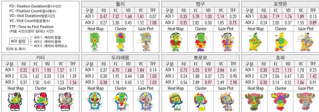
그림 1. 애니메이션 캐릭터 AOI 관심영역별 평균값 비교

아하는 이유로는 캐릭터가 친근해서(60.9%)라는 응답이 가장 높았으며 다음으로는 캐릭터의 외모가 좋아서(21.7%)의 순으로 나타났다. 캐릭터의 어떤 면을 선호하는지에 대한 응답은 외모(44.4%), 성격(44.4%)유머(8.3%)기타(2.8%) 순으로 나타났다. 성별에 있어서 선호하는 캐릭터는 남자는 피카츄(16명)도라에몽(13명), 여자는 짱구(13명)도라에몽(12명)의 순으로 나타났다.