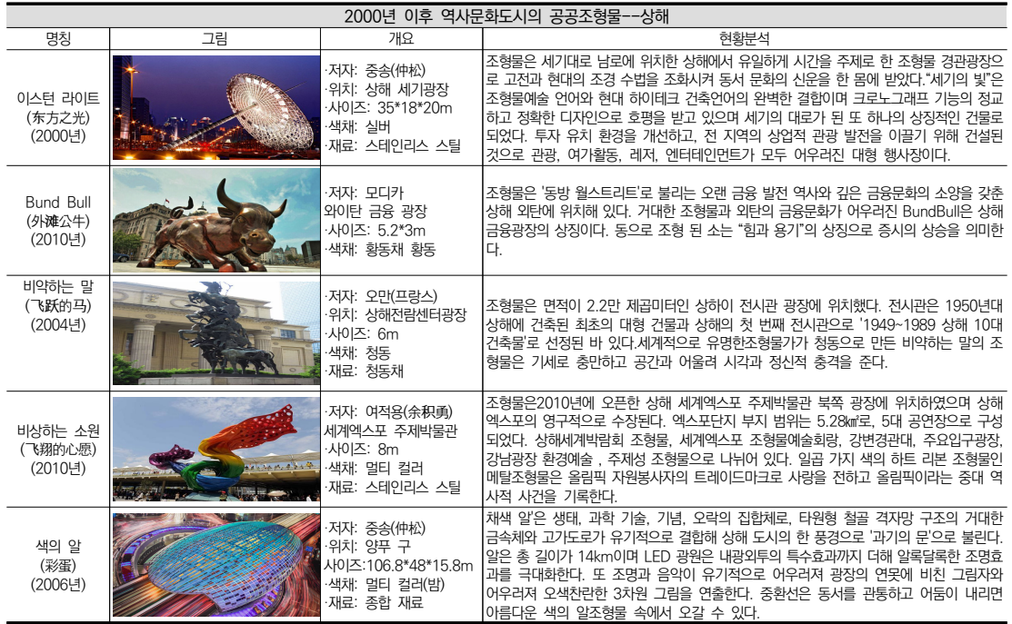
표 9. 2000년 이후 역사문화도시의 공공조형물--상해

은 월가의 구리소의 모양에서 유래한 것으로 상해 금융 광장에 높이 5.2m, 그 뒤로는 만국박람회 건축군이다. 중국에서 소는 근면과 풍요로움을 상징한다. 구리소는 힘과 용기의 상징으로 주식시장에서 영원한 상승세를 영위할 수 있다는 의미한다. 구리소 조형물은 장소와 완벽하게 어울리기 어려워 와이탄의 문화적 배경을 알아야 비로소 작품의 상징적 의미를 이해할 수 있다. <비약하는 말>은 높이 6m로 청동 주조되었다. 머리를 들어 길게 울부짖는 모습과 두 발 춤의 역동적인 비약은 역동성과 충분한 준비를 마치고 대기하는 기세참을 자랑한다. 상해 전시센터 광장에 위치한 조형물상은 중국 최초로 야외 공공공간에 장기 설치된 세계적인 칼미레스 의<비약하는 말> 작품으로, 밑받침에는 저가의 친필 서명으로 장소에 새로운 모습을 선사해 시각적, 정신적 충격을 준다. <비상하는 소원>은 상해엑스포 테마관 북쪽에 위치한 높이 8m의 조형물로, 외관의 한자 '마음'은 올림픽 자원봉사자의 상징으로, 화려한 일곱 가지 색은 자원봉사자의 부지런한 노동으로 엑스포에 진기한 색채를 더해 주고, 인간애를 전달하는 작품으로 중대한 역사적 사건인 올림픽을 기록하는 도심 광장의 영