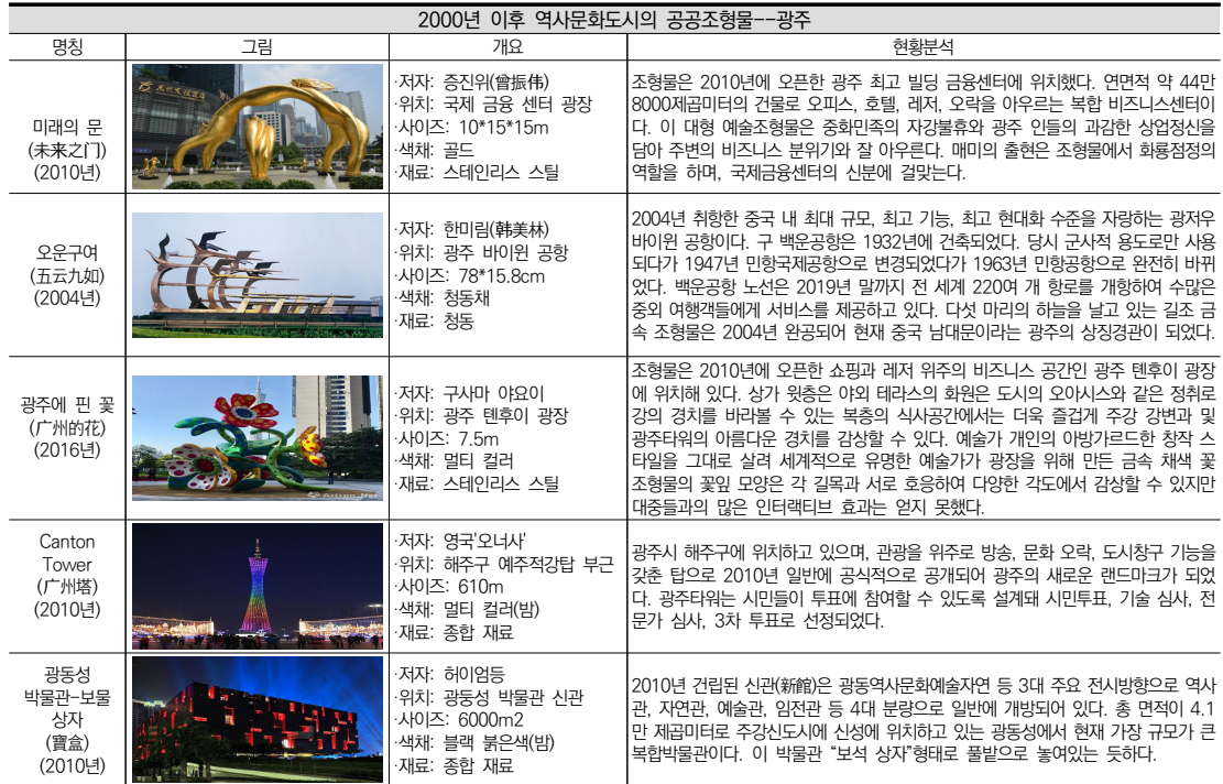
표 10. 2000년 이후 역사문화도시의 공공조형물--광주

은 광주 테후이 광장에 위치하고 있다. 스테인리스 스틸 소재, 높이 7.5미터로 쿠사마 야요이의 작품으로 '화성(꽃의 도시)' 광주를 위해 특별히 제작된 것으로, 네 개의 꽃잎은 특정한 시각에서 광장의 정원의 유리 케이스와 서로 어울려 눈부시게 빛난다. 서로 방향이 다른 꽃 들이 광장 주입구의 주요시선을 연결하여 방사 모양이 연장된 횡단보도와 서로 어울려 눈길을 끈다. 작품들은 예술가 개인 스타일의 작품으로, 현지 역사문화적 요소를 채택하지 않아 지역주민과의 상호작용성이 떨어져 보인다. <Canton Tower>은 총 높이가 600미터로 광주 주하이구에 위치하여 주하이 신도시, 화성 광장, 해심사도와 강건너로 서로 바라보고 있다. 조형이 간결하고 통일적이며, 윤곽이 뚜렷하며, 빙빙 돌며 올라가는 모습을 보여주었다. 밤의 오색 불빛과 강물은 서로 호응하여 도시의 급속한 경제 발전과 나날이 다각화되는 정신적 수요를 표현하였다. <보물 상자>는 광주시 신도시 중축선에 위치하고 있다. 광주 전통 공예 미술에서 기원하여 중국 광주의 독특한 조형물 예술을 구현하였다. 투조 조형물의 형식은 광주 도시의 오랜 역사