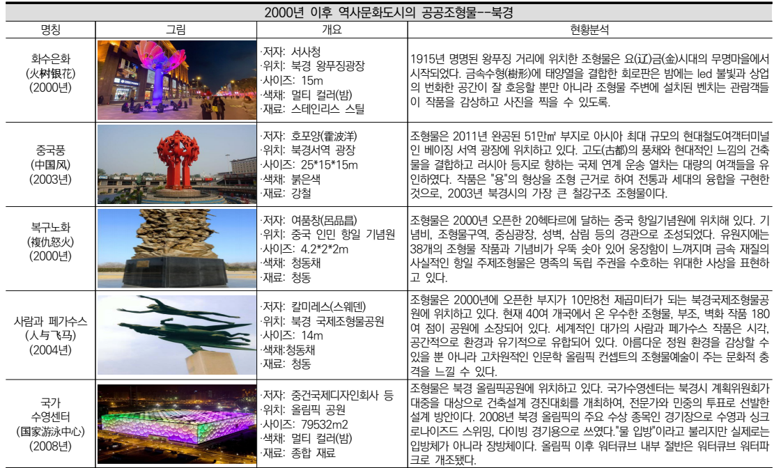
표 8. 2000년 이후 역사문화도시의 공공조형물--북경

화한 모습과 서로 호흡하여, 그 장소의 상업경제가 변영함을 잘 나타낸다. <중국풍>은 북경 서역 남광장에 위치하고 있으며, 높이 25미터의 강철판 재질로 제작되었다. 위치상으로 보면 조형물들이 경구철도의 용두(龍頭)인 동시에 북경발 열차의 시발역(時發驛)인 특정한 지리적 위치로 중화민족의 토토펀 '용' 이미지의 기호적 의미를 채용하기로 결정되었다. 세 마리의 거대한 용은 날로 번창하는 붉은 구형으로 하늘로 치솟은 것이 마치 화염과 같다. 디자인이 간결하고 거침이 없어 전통과 현대의 완벽한 조화를 이루어 현대 북경의 시대적 풍모를 표현하였다. <복구노화(復仇怒火)>는 '중국인민항일기념원'에 위치하고 있다. 4.2m의 청동재질로 조형물이 38개의 기념기둥 중 대표적인 하나로 중화 민족이 일본 침략자를 물리치고 민족의 독립 주권을 수호하는 주제를 표현하였다. 창작 주제와 공간 장소가 서로 융합되어, 작품은 현실주의의 사실기법을 충분히 활용하여 구상이 교묘하고 치밀하며, 무게감있게 세상 풍파를 겪은 느낌을 잘 표현하였다. <사람과 페가수스>는 높이 10m로 국제조형물공원에 위치하고 있다. 구리재질로 신화에 날개를 단 페가수스와 한 사람이 하늘로 날아오