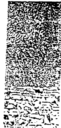
그림 3. 접합부 조직 A,B: 접합계면 / C: 모재