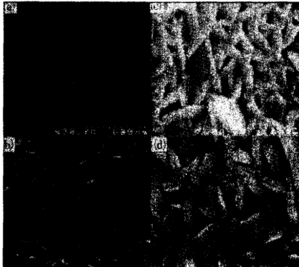
Fig.2 Scanning Electron Micrographs of ZnO films with thickness (a) 0.15 \mu\text{m} , (b) 0.5 \mu\text{m} , (c) 3 \mu\text{m} , and (d) 4 \mu\text{m}