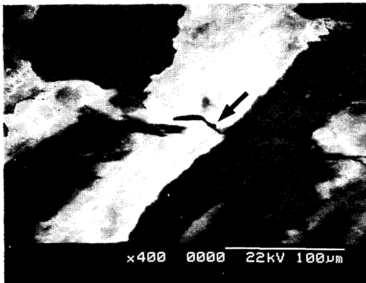
Fig.2 Worn surface of flame-sprayed coating and arrow(→) indicates sliding direction of ball