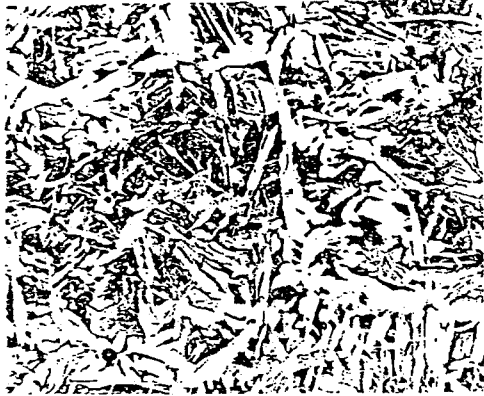
(A) MILD STEEL (145KJ/Cm)