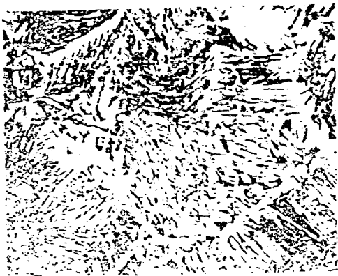
(E) MILD STEEL (216KJ/Cm)