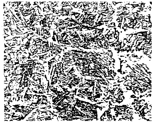
(D) TMCP STEEL (187KJ/Cm)