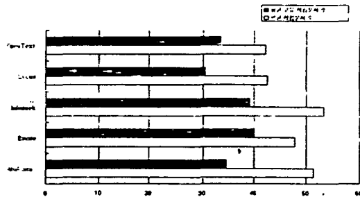
<그림 1> 각 탐색도구의 평균 적합문서 수와 평균 고유 적합문서 수

<그림 1>은 각 탐색도구가 검색해 낸 평균 적합문서 수와 평균 고유한 적합문서 수를 비교해 놓은 것이다.