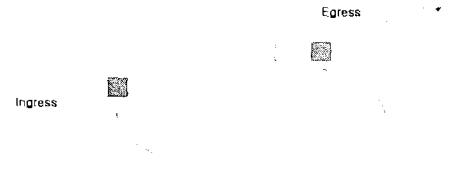
[그림 2] MPLS의 동작

[그림 2]에서와 같이 MPLS는 인그레스(Ingress)에서는 패킷의 레이블을 첨가하고, Intermediate 라우터에서는 레이블에 따라 패킷을 처리한다(레이블로 LIB를 검색). 또, 이그레스(Egress)에서는 패킷에서 레이블을 삭제한다.