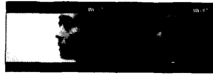
그림6: 급진적 장면전환을 잘못 검출한 경우(외부 조명변화와 카메라움직임으로 인해)