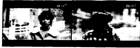
그림5: 급진적 장면전환을 검출하지 못한 경우(명도와 에지 데이터가 프레임간에 유사하다)