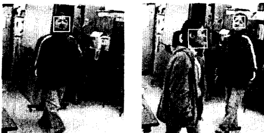
그림 3 (a) 1명 추출 (b) 2명 추출