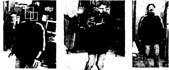
그림 4 (a) 오 탐지 (b) 미 탐지 (c) 미 탐지

그림 4에 미 탐지(miss)와 오 탐지(false alarm)의 예가 나타나 있다. 미 탐지의 경우는 그림 4(b)에서 보는 바와 같이 사람이 손을 머리위로 들었을 때와 같이 사람의 얼굴 영역이 움직이는 사람 영역에서 일정한 높이에서 시작하지 못하였을 때와 혹은 그림 4(c)와 같이 얼굴 영역이나 움직이는 사람의 영역이 너무 작을 때 나타난다. 오 탐지의 예는 그림 4(a)에 나타나 있는데 하나의 얼굴이 작은 두 개의 영역으로 나뉘어 두 개의 얼굴로 오 탐지되고 있다.