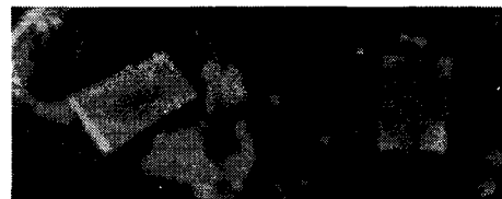
Fig. 4 Listeria monocytogenes