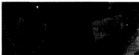
Fig. 3 Esheriachia coli O157:H7

Fig. 1과 Fig. 2는 균을 배양한 후에 항균 처리된 시료를 접종하여 항균성을 확인한 것으로 Esheriachia coli O157:H7에서 에탄올 추출물의 경우는 20 \mu l를 적용하였을 경우 배양된 균이 죽어 clear zone이 형성이 되는 것을 확인하였다. 그러나 10 \mu l를 적용하였을 경우와 Listeria monocytogenes 의 경우 모두 clear zone이 형성이 되지 않았다.