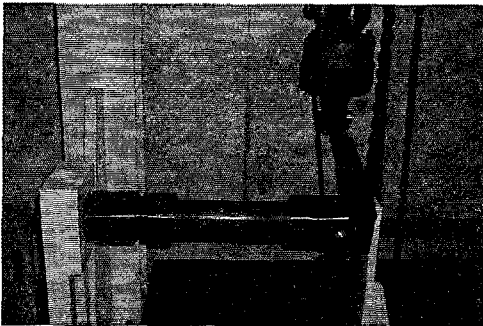
그림 3. 비틀림 강도 실험

그림 2는 비틀림강도 해석치를 나타낸 것으로서 233MPa의 응력이 국부적으로 금구에 집중되는 양상을 나타내고 있음을 알 수 있다. 금구에 집중된 응력은 Fitting의 방법을 개선하여 응력의 분산을 유도하는 방법임 알 수 있다.