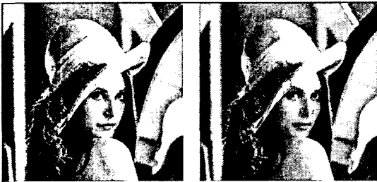
그림4. Lenna 원이미지(좌) 복원이미지(우)