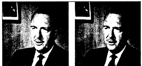
그림1. Cronk 원이미지(좌) 복원이미지(우)

사용한 PC는 CPU: P-IV 1.6GHz, Memory: 256M에서 수행하였다.