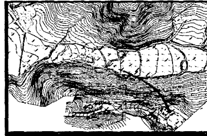
Fig. 47. Groundwater flow direction and particle pathlines(MODPATH)

유류저장탱크에서 유류가 지속적으로 지하수를 오염시켰을 경우의 이동형태를 모의하였다. 모델링의 목적이 오염물질의 이동경로를 파악하는데 있으므로 흡착은 고려하지 않았다. Fig. 5에서 볼 수 있듯이 전체적으로 오염물질의 이동이 느리며 산 정상부의 유류저장탱크에서 최초 유류누출지점이 있는 논쪽으로 이동하는 것을 보여준다.