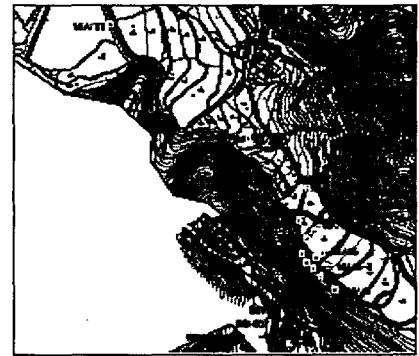
Fig. 2. Equipotential lines distribution and groundwater flow direction

연구지역에 총 13개소의 지하수 관측정을 설치하였다. 지하수 흐름방향을 고려하여 최초 유류 누출이 확인된 부근을 중심으로 11개 관정(MW1~MW9)을 설치하였으며, MW10과 MW11 관정은 지역의 하부에 설치하여 오염확산 범위 및 지하수 흐름을 추정할 수 있도록 하였다. 이와는 별도로 연구지역의 산등선을 따라 4개의 관측정을 설치하였다. 유류오염물질의 이동방향이 지하수 흐름 방향과 일치할 것으로 판단, 모델링은 현재 상태의 수리지질학적 조건을 재현하는 정류(steady state)모사와 정류모사 결과를 바탕으로 MT3D를 이용한 오염물질 이동을 모의하는 부정류(transient state)모사를 수행하였다.