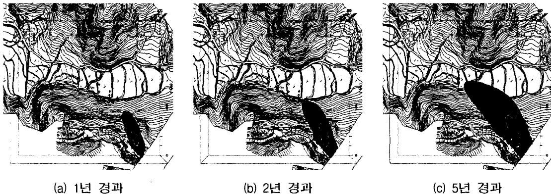
Fig. 5. Transport model of oil leaking from oil storage tank

Fig. 6은 현재 오염상태에서 추가 오염원이 제공되지 않는 상황, 즉 산 정상부의 오염원인 유류저장 시설이 제거되었을 경우를 가정하여 오염물질의 이동을 모의한 결과이다. 오염물질 거동이 시작된 후 2년경과를 기점으로 하여 이후의 오염농도 분포는 모든 지점에서 검출한계 이하로 나타났다.