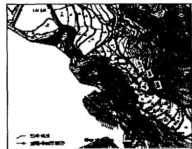
Fig. 2. Equipotential lines distribution and groundwater flow direction

Fig. 3은 조사지역의 지하수위의 분포를 나타낸 것이며, Fig. 4에는 조사지역의 지하수 흐름을 나타내었다. 전체적으로 산 정상부와 남동쪽 논의 지하수위가 높게 형성되어 북서쪽으로 이동하는 것을 알 수