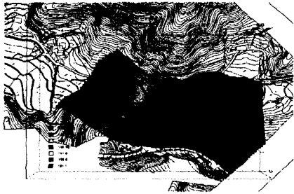
Fig. 46. Results of modeling : groundwater level distribution

있다. 또한 MODPATH를 이용한 입자 추적 결과 산 정상부의 유류저장탱크에서 최초 유류누출지점이 있는 산 하부로 유류오염물질이 이동하는 것으로 예측되었다.