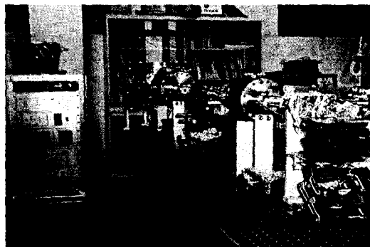
그림 3. Construction of X-ray Microscope System