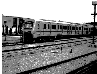
그림 2 아테네현지 시험