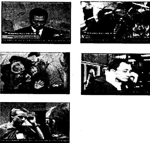
그림 3. CNN 비디오 클립

다음의 그림들은 실험에 사용된 영상의 예와 누적 히스토그램 기법과 제안된 기법의 Recall과 Precision 비교 그래프를 보여준다.