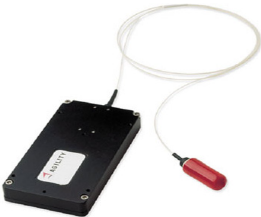
그림 1. Agility사의 Tunable LD

즉, 트랜스폰더는 시스템 가격 및 운용 및 유지보수 비용을 결정하는 주 요인이 되어 운용 파장 수 만큼 예비 유니트가 필요하게 되어 운용 및 유지보수 비용이 과다하게 소요됨으로써 시스템 전체 가격을 결정하는 주 요인이 된다.