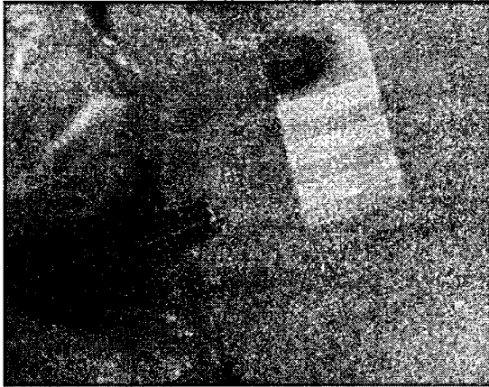
(A) BOTTOM EMISSION TYPE OLED 구동전