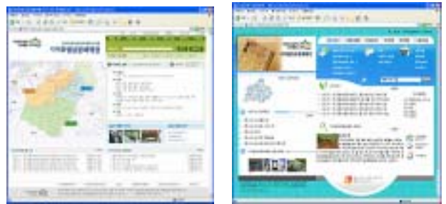
[ 5 ]