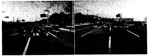
<그림 2> 횡·종방향 그루빙

그루빙의 방향으로는 주로 종방향(자동차 진행 방향)과 횡방향(자동차 진행 방향에 대해 직각 방향)으로 나눌 수 있다. 종방향 그루빙의 경우는 횡미끄럼에 대해 효과가 있으므로 곡선 구간에 적합하다. 반면 횡방향 그루빙의 경우는 제동 정지 거리의 단축, 수막 현상 억제, 배수 경로 제공, 조면 조직 회복 등에 효과가 있으며, 급경사, 교차로 등에도 적합하다.