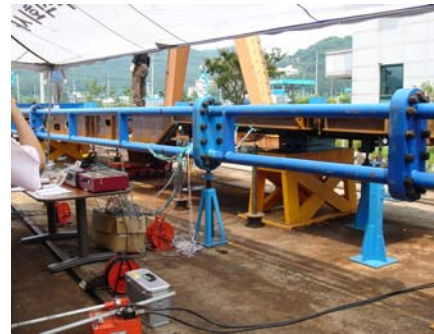
Fig. 2 Loading test equipment