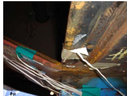
Fig. 3 Strain gauge of the underframe