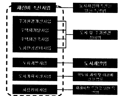
그림 2. 도시재생 관련사업 및 제도(법)현황

도시재생을 위한 개발사업은 현재 국내 제도적 측면에서 '도시재생비축진을 위한 특별법'에 따른 재정비 촉진사업으로 볼 수 있다. 재정비 촉진사업은 4개의 관련법 1) 에 따라 7개의 사업으로 분류(그림2)되어 있으며 그 중에 도시환경 정비사업에 관한 시행단계별 업무를 정리하면 표1과 같다.