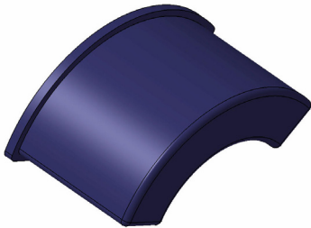
Fig. 2 블래더 형상

다층구조 블래더에 사용된 소재들은 내연료유성 및 내구성을 감안하여 개발하거나 선정되었으며, 각 소재의 특성은 다음과 같다.