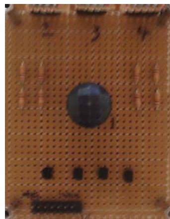
▶▶ 그림 2. 모션 센서와 주변 회로

그림 2에서는 모션 센서와 주변 회로와 감시카메라 연결을 하도록 만든 부분을 나타내었다.