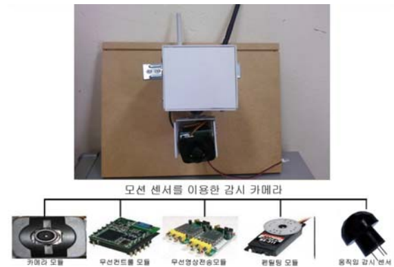
▶▶ 그림 1. 모션 센서를 이용한 감시 카메라

카메라 부분은 카메라, 무선통신부, 무선영상전송부, 팬틸팅부, 스텝모터부 이렇게 5가지 모듈로 구성되어 있다. 카메라는 sharp사의 카메라 모듈을 사용하였다. 무선으로 영상을 송·수신하기 위하여 ecom사의 2.4GHz의 무선영상 모듈제품을 사용하였다. 카메라 PTT컨트롤 및 데이터 송·수신을 하기위하여 roboblock의 ZigBee ZBS-100 무선컨트롤 송수신 모듈을 사용하여 서버로부터 신호를 주고 받는다. 모션 센서 모듈에는 PANASONIC의 AMN14111를 사용하여 움직임을 검출 한다. 카메라의 방향을 바꾸어 주기 위하여 HITEC사의 서보모터 HS-311 2개를 이용하여 팬틸팅 한다. 그림 1에서는 모션 센서를 이용한 감시 카메라의 구성을 나타내었다.