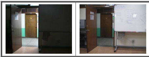
▶▶ 그림 6. 실험환경

실내에서 어두운 환경, 밝은 환경, 그리고 실외에서 . 이동이 감지가 되었을 경우 영상을 녹화하고 최후 감지 후 3초 동안 녹화를 계속하였다.