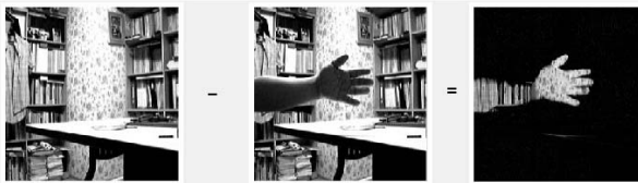
▶▶ 그림 4. 프레임 차를 이용한 움직임 검출

기존의 움직임 검출 시스템은 아래 그림 4와 같이 두 영상 프레임의 차를 이용하여 나온 결과 영상을 이용한 방법이다.