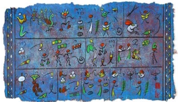
▶▶ 그림2. 동파문자 벽화

동파문자의 유희성은 현대사회의 새로운 요구와 새로운 심미적 체험이다. 색채 면에서 동파문자는 강렬한 음양, 선악, 미추관을 갖는다. 동파문자는 색채가 있는데 서로 다른 색채는 서로 다른 의미를 대표한다. 동파문자가 현대의 기호, 도안, 로고 등에 비해 감정표현에 있어 특수한 의미를 갖는다. 그것은 현대인에게 동파문자가 가지고 있는 그 원시성과 자연성에서 느낄 수 있는 근원적인 순수함이 주는 즐거움이라고 할 수 있을 것이다.