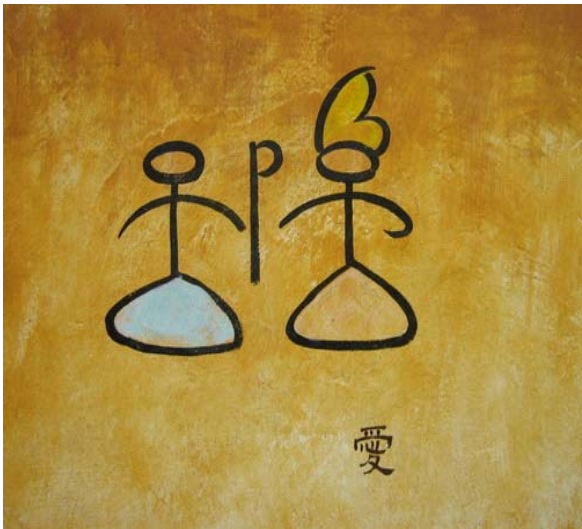
▶▶ 그림3. 동파문자 '사랑해요'