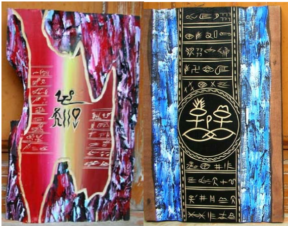
▶▶ 그림2. 동파문자 장식화

동파문자의 장식성은 글체, 색채, 라인, 위치 등에 따라 서로 다르다. 동파문자의 도상적 특성은 엄숙함, 긴장감, 가벼움, 해학적, 화려함, 우아함, 투박함, 소박함을 가지고 있다. 동파문자의 의미전달력은 동파문자가 어떤 커뮤니케이션 환경에서도 충분히 그 역할을 수행할 수 있는 의미의 함축적 표현이 가능하다.