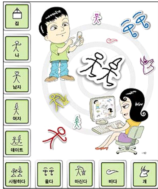
▶▶ 그림4. 일본에서 유행하는 동파문자, 휴대전화, PC에서 사용할 수 있는 동파문자 번역 프로그램이 있다. 일본어를 치면 동파문자로 번역되 나온다.