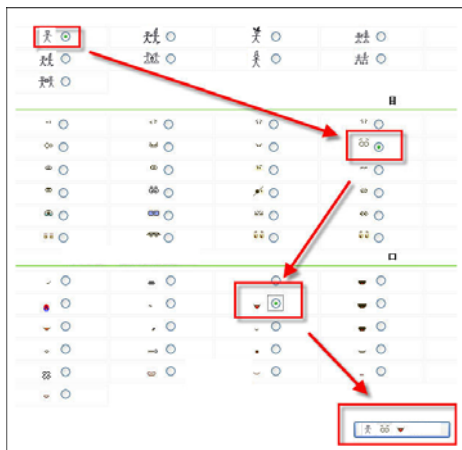
▶▶ 그림6. 동파문자와 기존 이모티콘과의 결합을 통한 새로운 이모티콘 생성 방법의 예

기존에 사용하고 있는 대부분의 이모티콘은 모두 사용자가 사용하기 전 이미 전문적인 디자이너에 의해 제작 완성된 것으로 고정적이다. 하지만 개성을 추구하려는 젊은이들은 비대면 커뮤니케이션에서 자신의 개성을 부각시키기 위해서 다른 사람과 차별화되기를 원하는데, 이러한 요구는 동파문자를 이모티콘으로 활용함으로써 요구에 부응할 수 있다. 동파문자의 기동성(機動性)과 즉시 조작성(操作性)은 기존의 이모티콘의 불변성을 변화시킨다. 왜냐하면 사람들마다 표현하고자 하는 의미가 서로 다르고 서로 다른 의미가 대응되는 상형문자가 서로 다르기 때문에 이를 조합시키면 더욱 특별한 이모티콘의 생성을 통해 개성적인 감정을 표현할 수 있게 된다. 사용과정에서 서로 다른 문자를 선택하여 기존의 이모티콘과 결합시켜 자신이 원하는 표정과 문자를 창조할 수 있다. 때문에 문자게임의 효과가 있으므로 현대 젊은이들의 추구하고자 하는 개성과 심리를 만족시킬 수 있는데, 즉 직관적이고 흥미성이 더욱 강하며 게임과 창조의 효과까지 증가시켜준다.