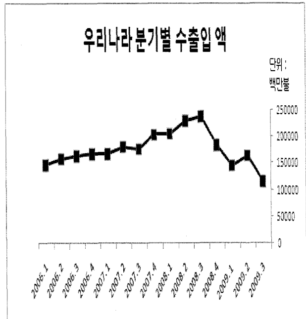
Fig. 1 우리나라 분기별 수출입액 자료 : 한국무역협회(2009), http://www.kita.net/

글로벌 경제위기로 인해 전세계적으로 경제적인 침체를 맞고 있는 가운데 특히 우리나라의 무역량은 Fig. 1에 나와 있는 바와 같이 2008년 2분기를 정점으로 하여 2009년 3분기까지 지속적인 하락세를 보이고 있다. 이러한 무역량의 감소는 특히 수입의 감소가 주된 원인으로 이는 무역수지 흑자로 나타나지만 항만의 입장에서는 총물동량 감소로 이어지게 되어 화물의 수급에 있어 부정적인 영향을 미치게 된다.