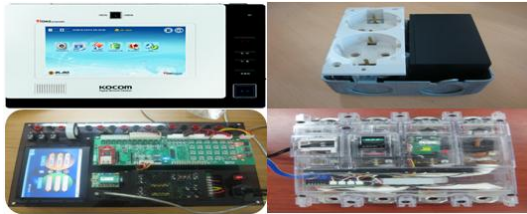
그림 2. u-IT Convergence 전력 기기들

u-IT Convergence 가전 기기로는 인터넷 냉장고, 인터넷 전자레인지, 인터넷 세탁기, 인터넷 에어컨, 대화형 TV, 인터넷 게임기, 셋톱박스, 청소로봇 등이 포함된다. 그림 2는 u-IT Convergence 를 이용한 전력기기들이다.