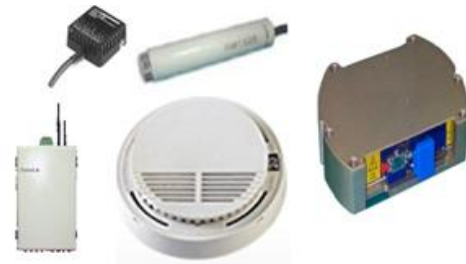
그림 3. u-IT Convergence 기기 센서 측정기

단거리 무선 통신인 Wall-pad의 경우 NT-RF901과 ZigBee를 사용하여 공중선 전력을 10mW 이하로 하고 송수신거리를 500m이상 개방구간으로 설정하고 주파수 범위는 2.405~2.480GHz로 하고 동작 온도는 -20°C~60°C로 하고 프로토콜은 IEEE802.15.4 Standard 통신 프로토콜로 확장성은 65000개의 센서 노드를 연결 가능한지 확인한다. 또 고전력 증폭기와 RFID를 이용하여 미세 초고주파신호를 100만배 증폭하여 고장 감지 기능을 시험하고 히터 예열 감지 회로를 적용하고 50nsec 이하의 상승/하강 시간을 측정한다. 온도센서에는 HTS2030SMD를 사용하여 -60°C~ 140°C의 시험하고 습도센서에는 HM1520을 사용하여 1~20% RH의 시험을 하였다. 화재 센서에는 SS-200F로 열감지 센서는 1회성으로 열과 연기를 동시에 감지하고 멀티센서보드로 화재감지 여부를 전송하는지 확인하였다.