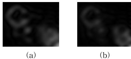
그림 2. 투영 영상을 1회 반복하여 재생한 홀로그램: (a) 재생 거리 204.2 mm, (b) 재생 거리 213.9 mm