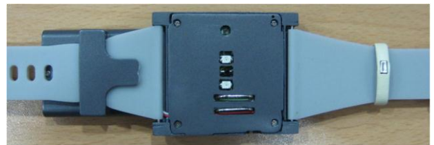
그림 2. 손목시계 타입의 센싱디바이스

그림 1 은 센싱디바이스와 GPS 수신기로부터 데이터를 측정하고 지도에 시각화하는 절차를 도식화 하였다. 다음은 각 단계별 설명이다.