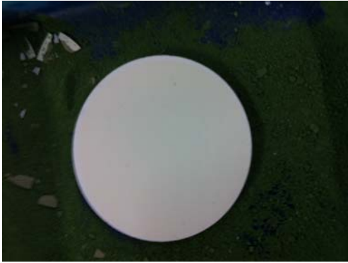
Fig. 2 Half Cell using dry press process