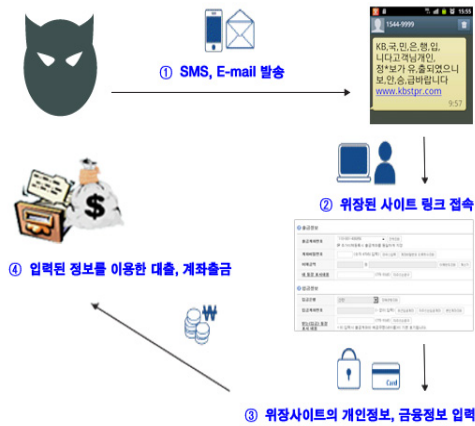
그림 1. 피싱 사고 발생도

보이스 피싱(Voice Phishing)은 '전화를 통해 개인정보를 낚아 올린다는 뜻이다. 이는 전기통신수단을 이용한 비대면 거래를 통해 남을 속여 남의 금전을 편취하는 특히 금융 분야에서 발생하는 일종의 사기 범죄이다.