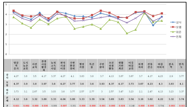
그림 1. 행복마을 거주자의 대상지별 만족도 분석