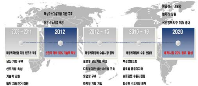
Fig. 3 Stepwise development strategy of marine leisure equipment industry

또한 전통적인 마리나 임대료가 주를 이루던 과거와는 달리 오늘날의 마리나는 서비스의 질에 따라 마리나의 평가가 이루어지므로 오락 이벤트, 호텔, 항공 예약, 쇼핑 등 컨시어지 서