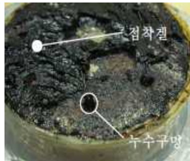
사진 3. A 시험체(4℃)