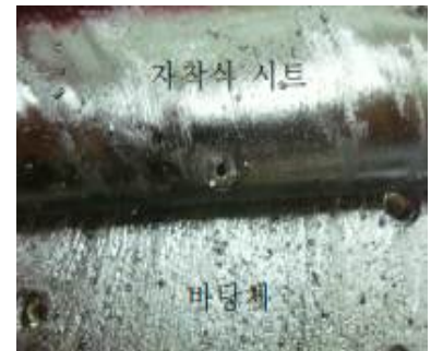
사진 4. B 시험체(4℃)