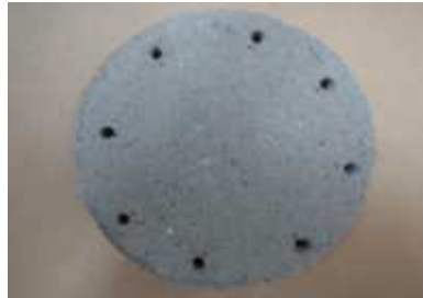
사진 1. 바탕체 현황