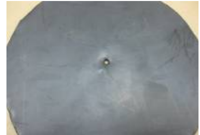
사진 2. 시험체 현황