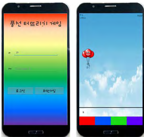
(그림 2) 풍선 터뜨리기 게임 실행 화면

본 어플리케이션의 풍선은 빨간색, 하늘색, 초록색, 보라색으로 구성되어 있으며 색깔별로 ID를 부여하였다. 게임 실행 시 각각의 색깔 풍선이 시간에 따라 생성되면서 각각의 라인에 맞춰서 화면 상단에서 하단으로 내려온다. 풍선이 하단의 검은 선에 도달하기 전에 사용자는 풍선의 색에 따라 색에 알맞은 색이 있는 버튼을 확인하고 버튼을 터치하여 풍선을 터뜨리면서 게임을 진행하게 된다. 그림 2는 풍선 터뜨리기 어플리케이션 화면을 나타낸다.