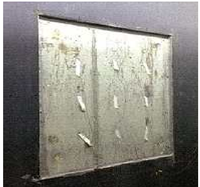
그림 2 KS F 2277에 따른 벽체 열성능 실험

KS F 2277은 벽, 지붕, 천장, 바닥 등의 건축용 구성재의 단열성능으로서의 열관류율, 열저항 등을 보호 열상자 법 및 교정 열상자법에 의하여 측정하는 방법으로 열상자에 시험체를 고정하고, 항온실과 저온실에서 발생하는 열 흐름을 통해 열관류율을 분석할 수 있다. 본 실험에서는 항온실 온도 20.2도, 저온실 온도 -0.33도의 조건에서 KS 2277에 따른 실험을 진행하였으며, 그 결과 총 공급열량 25.07 W 시험체 통과 열량 11.25 W로 전체 열관류율은 0.55 W/m^2k 로 나타났다.